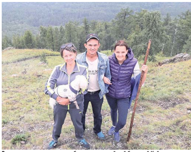
Дружная семья с домашним любимцем – мальтийской болонкой Кай

Храм в больнице обрёл для меня новый смысл. А сейчас, кстати, мой молодой человек поёт в церковном хоре.