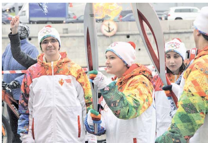
Это было в Москве перед Олимпиадой в Сочи