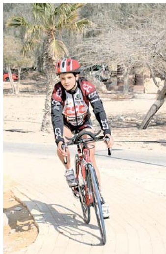
Велосипед – важная составляющая триатлона