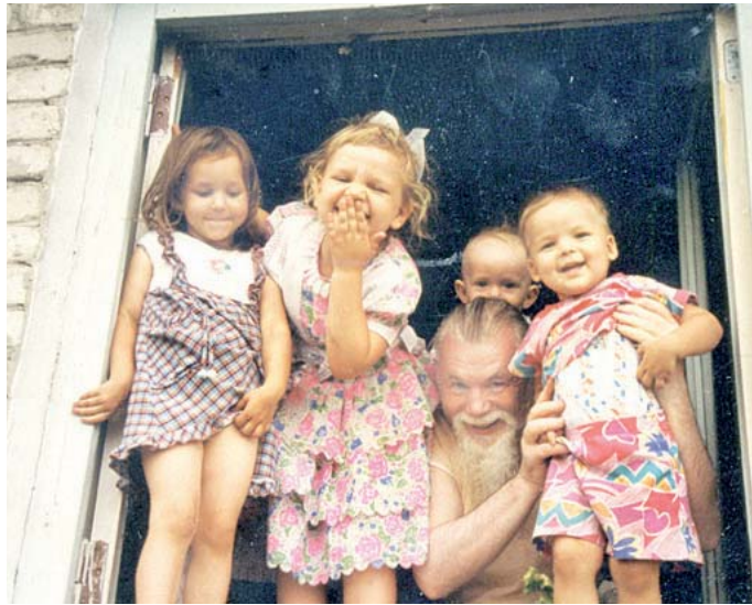
Счастье деду – это внуки!

Все мы люди и в жизни у нас бывают неоправданные греховные ошибки. И тогда в жилище спокойно поселяется бесовская сила, а жизнь превращается в слёзный ад. Я, Божией мило-