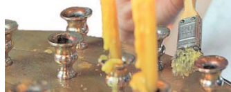
«Господи, спаси и сохрани...»