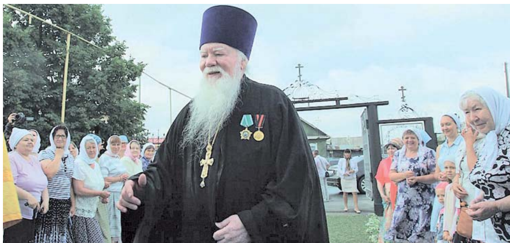
В день 130-летнего юбилея храма Петра и Павла

к тебе приехал. Предлагаю быть соучастником вашей церковной благотворительности, ежемесячно выделять мясную продукцию птицефабрики. Пока жив, буду поддерживать.