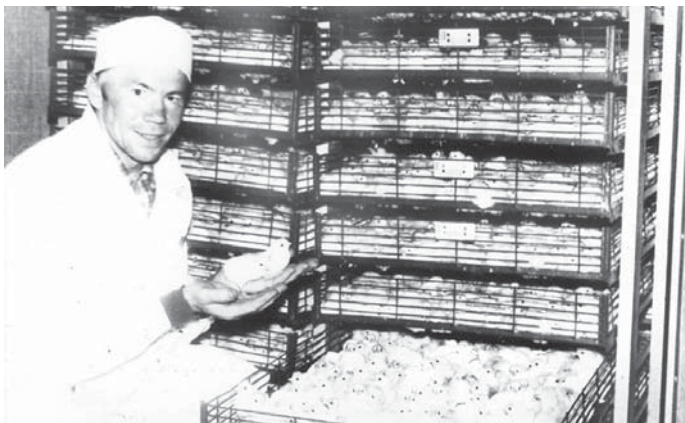
Растите цыплятки большие!

...Столбы, мало того, что тонкие, но ещё и обледеневшие. Пошевелиться на столбе почти невозможно, много раз скатывался вниз.