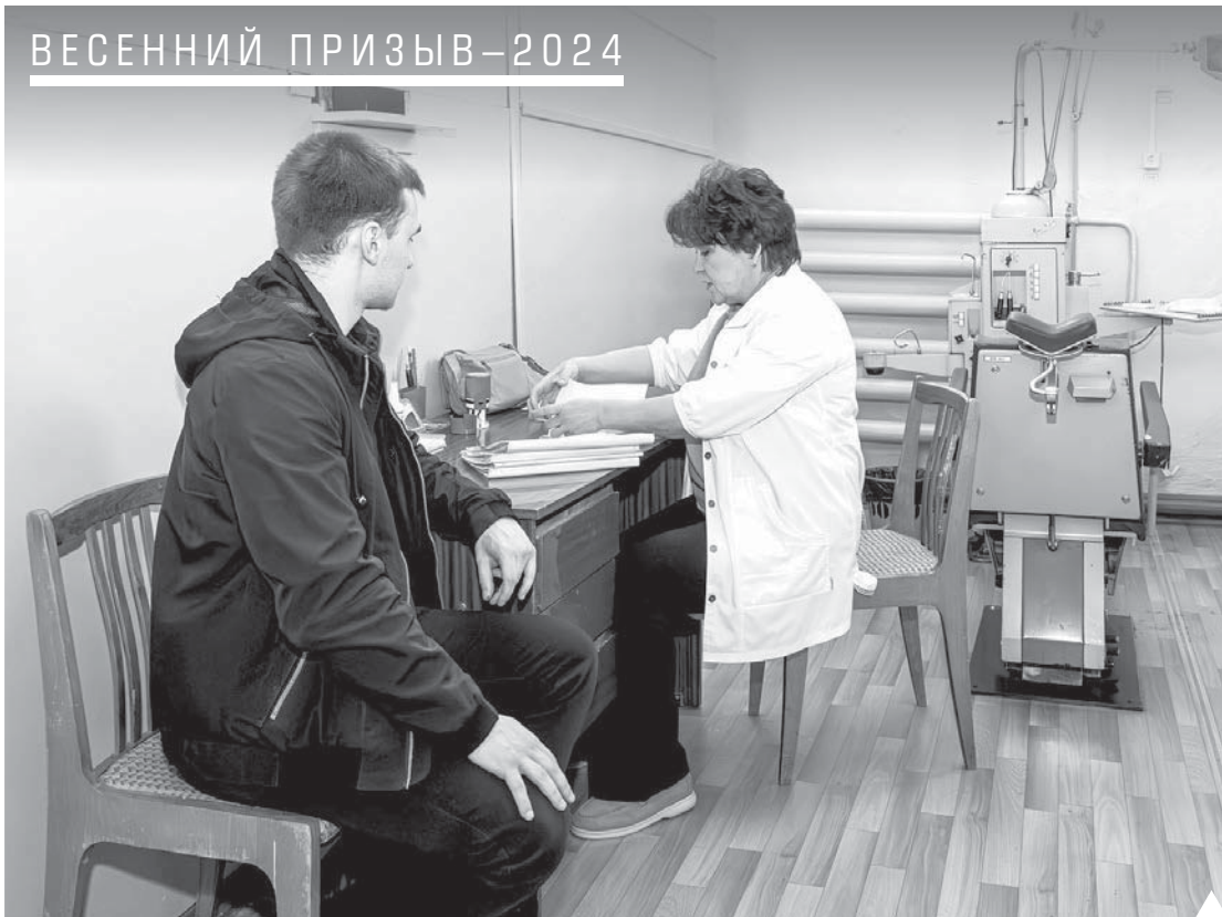
Призывники проходят медицинскую комиссию