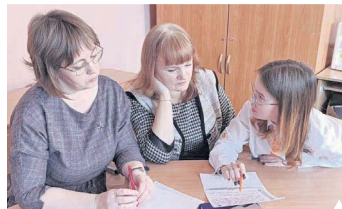
На семинаре обсуждали непростые вопросы

Что за упражнения на функциональное чтение, в чём их отличие от стандартных предметных учебных задач, каков алгоритм создания подобных заданий – об этом шла речь. Участники семинара получили ответы на вопросы: как организовать системную работу на уроке по формированию функциональной грамотности у школьников, как работать с учебными заданиями и текстами на уроках, какова роль учителя начальных классов?