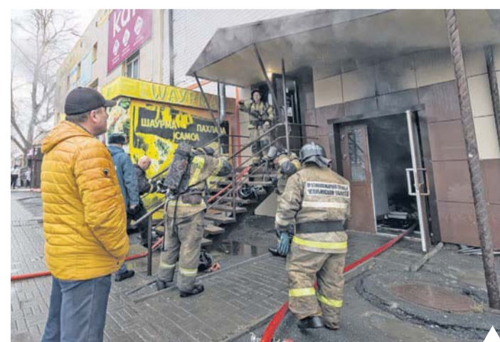
Локализация и ликвидация пожара в ТК заняла около часа

Огонь полностью уничтожил товары в этом отделе, остальные не пострадали.