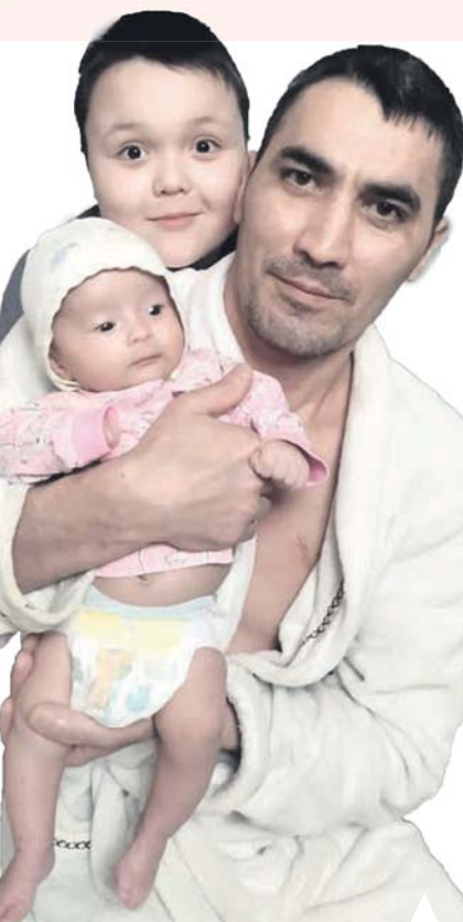
«Алмаз» сражается за будущее Алмаза и Азамата