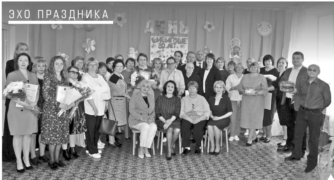
Хранители «книжного царства» прививают коркинцам тягу к чтению