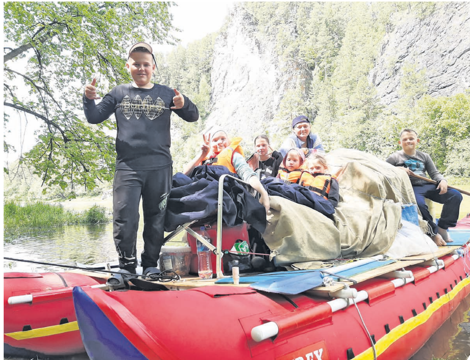
Сплав на катамаране по реке Ай в 2022 году