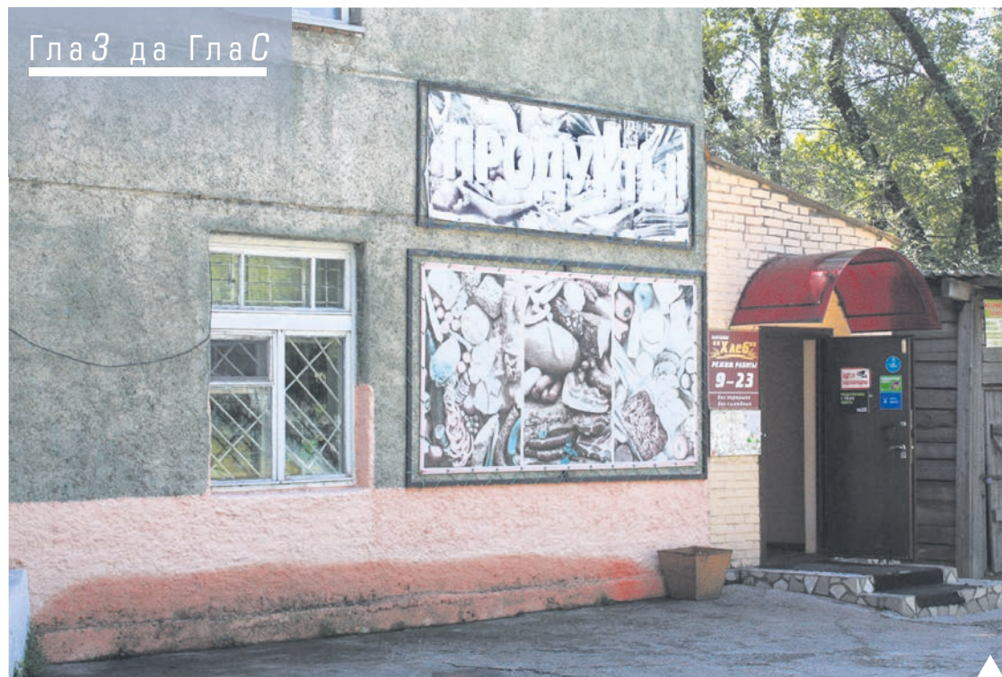
«Наливайки» в многоквартирных домах беспокоят жителей