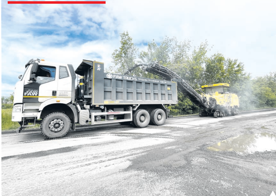
Срезают старое асфальтовое покрытие на дороге Коркино – Роза