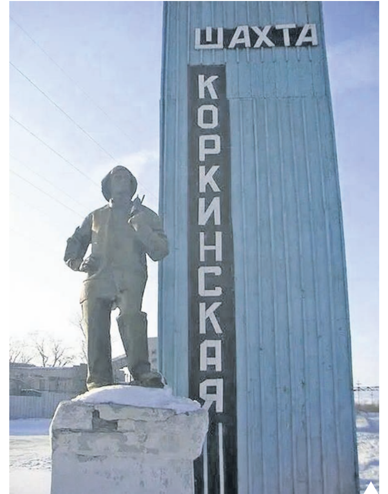
Вот такая композиция встречала на территории шахты

– Было у нас звено мусульман, как мы их по-доброму называли – Баянов, Мухьянов, Мухаяров, Риянов... Нам часто доставались тяжёлые обводнённые забои, но мы их