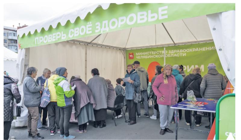
Самая популярная площадка – министерства здравоохранения

подготовку были в основном студенты, они отжимались, подтягивались, толкали гирию весом 16 килограмм, качали пресс, показывали гибкость и прыгали в длину. Всего проверили себя решились 197 человек. Все участники успешно справились с предложенными тестами ГТО и получили сувениры с символикой фестиваля и комплекса.