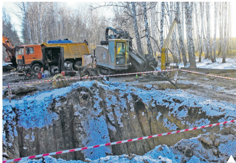
Идёт разработка траншеи