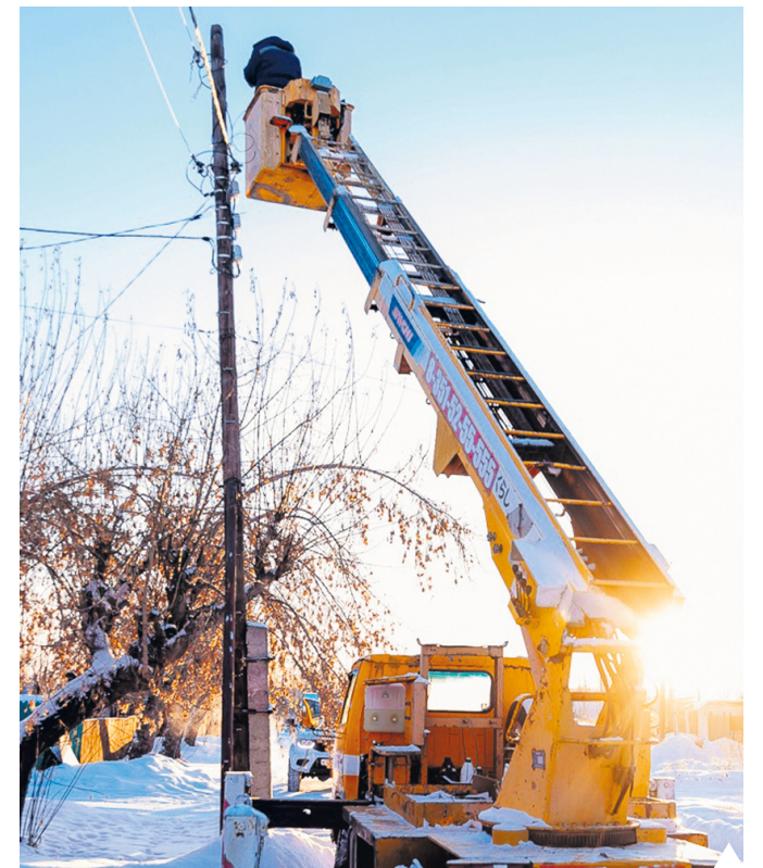
Установка светильников

На первом этапе, до весны установят 202 светильника. В дальнейшем сформируют новый план освещения.