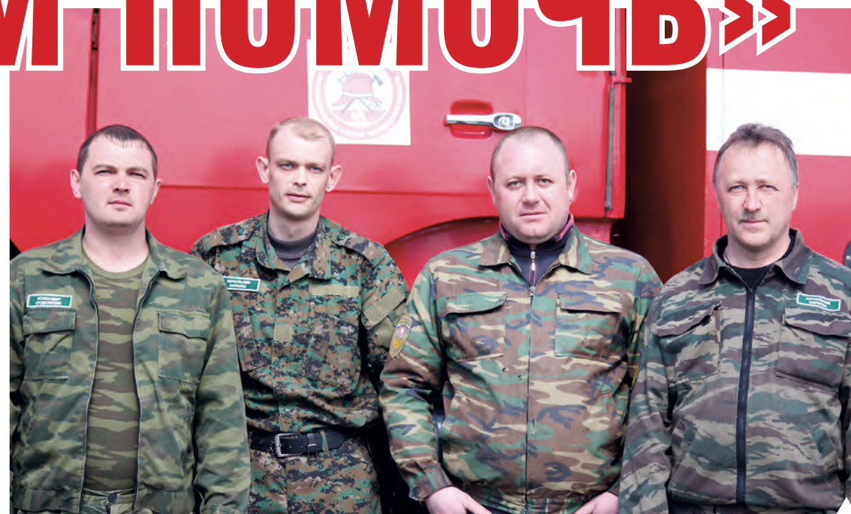
Начальники караулов 107-й пожарной части