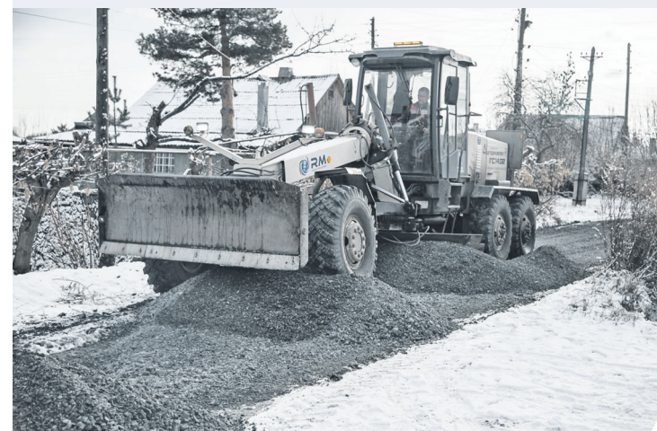
Отсыпка дорог на Старом строительстве