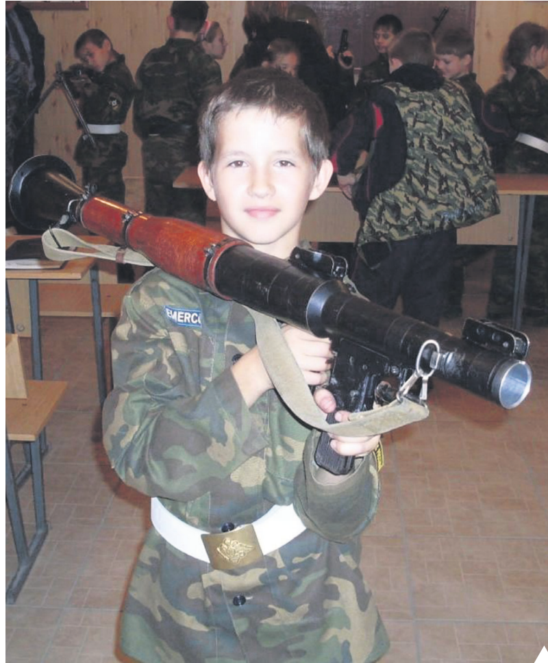
Кадеты рано знакомятся с оружием