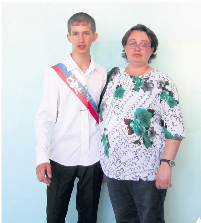
С мамой на выпускном после окончания девятого класса

– После загса молодожёны купили цветы и поехали в КГСТ к Наталие Нерух. А потом заехали на кладбище к Алёне, положили букет цветов на могилку, поплакали, извинились и уехали домой отмечать свадьбу в большом кругу своих семей.