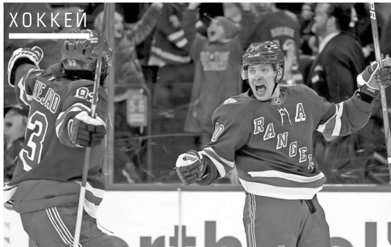
Артемия Панарина могут скоро обменять в другой клуб

Коркино – уникальный хоккейный город. И хотя знаменитая команда «Шахтёр», собиравшая полные трибуны стадиона «Труд» (ныне – «Горняк») в 60-70-е годы прошлого века, выступая в классе «Б» чемпионата СССР, уже давно не радуется успехами, однако именно три наших земляка выступают на высочайшем уровне. Причём, двое – внуки тех легендарных игроков.