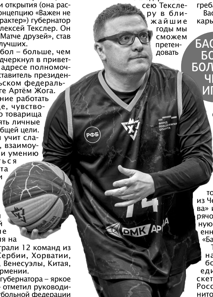
Губернатор был одним из лучших в «Матче друзей»