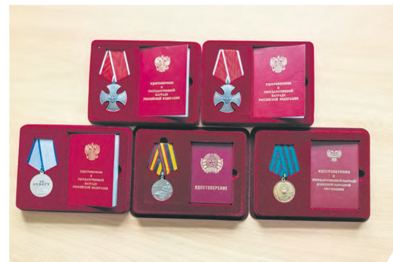
Ордена и медали Виктора Колодяжного