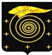
СХЕМА ТЕПЛОСНАБЖЕНИЯ КОРКИНСКОГО МУНИЦИПАЛЬНОГО ОКРУГА ЧЕЛЯБИНСКОЙ ОБЛАСТИ НА ПЕРИОД ДО 2032 г. (актуализированная редакция)

Приложение к постановлению администрации Коркинского муниципального округа от 10.04.2026 г. № 430