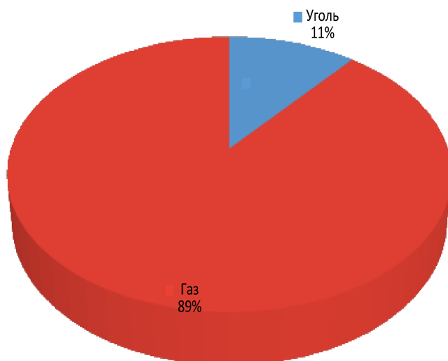
Процент используемого топлива на котельных