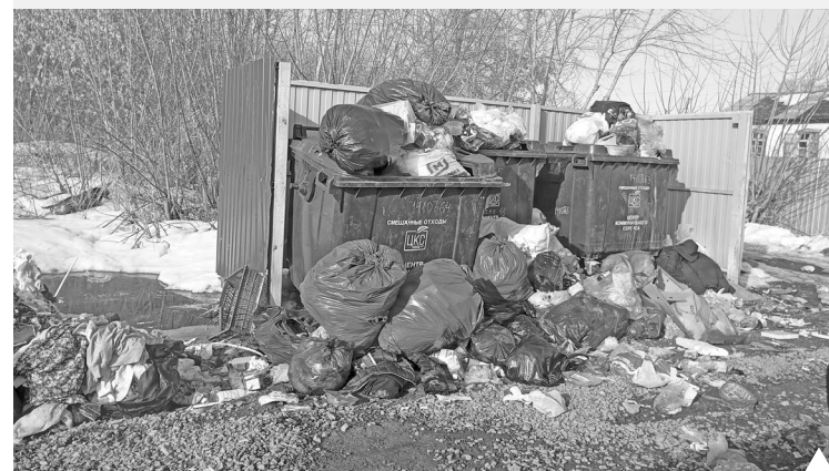
Вот так выглядела одна из контейнерных площадок в момент обследования

По фактам выявленных нарушений прокуратура города внесла представления службе коммунального сервиса Коркинского округа, а также в управляющие организации: ООО «Интерьер» и ООО «Стимул».