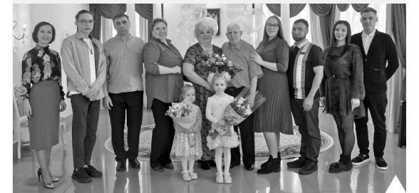
Супругов поздравили в отделе загс

Виновники торжества оставили свои подписи в Книге почёта юбилейных супружеских пар нашего округа и станцевали свадебный вальс.