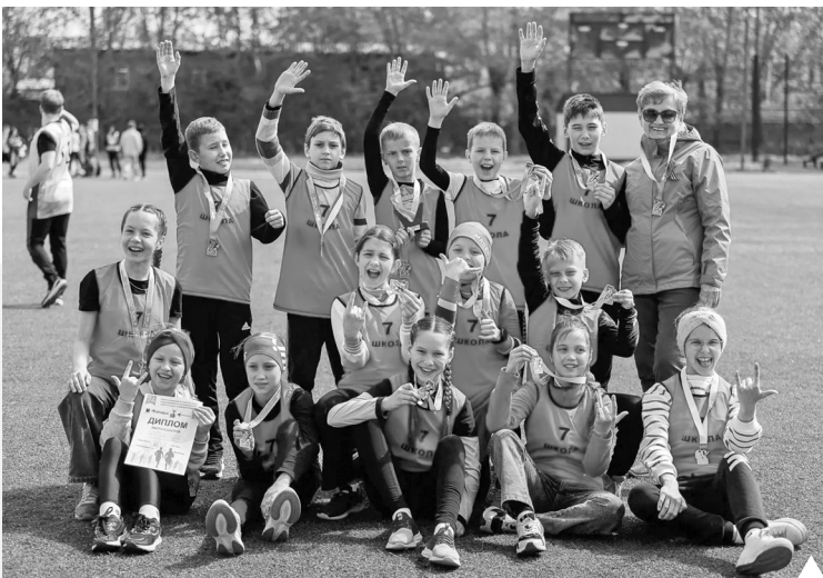
Команда школы № 7 – чемпионы эстафеты прошлого года!

Материалы конкурса «Моя эстафета» приносите в редакцию по адресу: улица Маслова, 1, кабинет № 211 или присылайте на электронную почту: gp-gazeta@mail.ru до 1 мая.