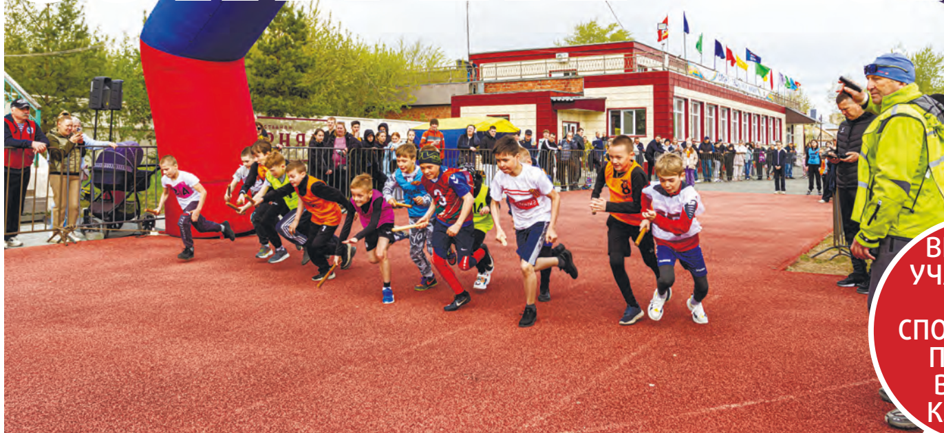
Так эффектно на 74-й эстафете стартовали младшие школьники

даря генеральному партнёру эстафеты – Томинскому ГОУ.