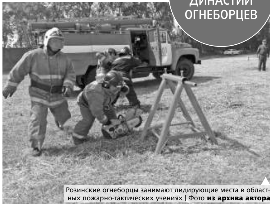
Розинские огнеборцы занимают лидирующие места в областных пожарно-тактических учениях