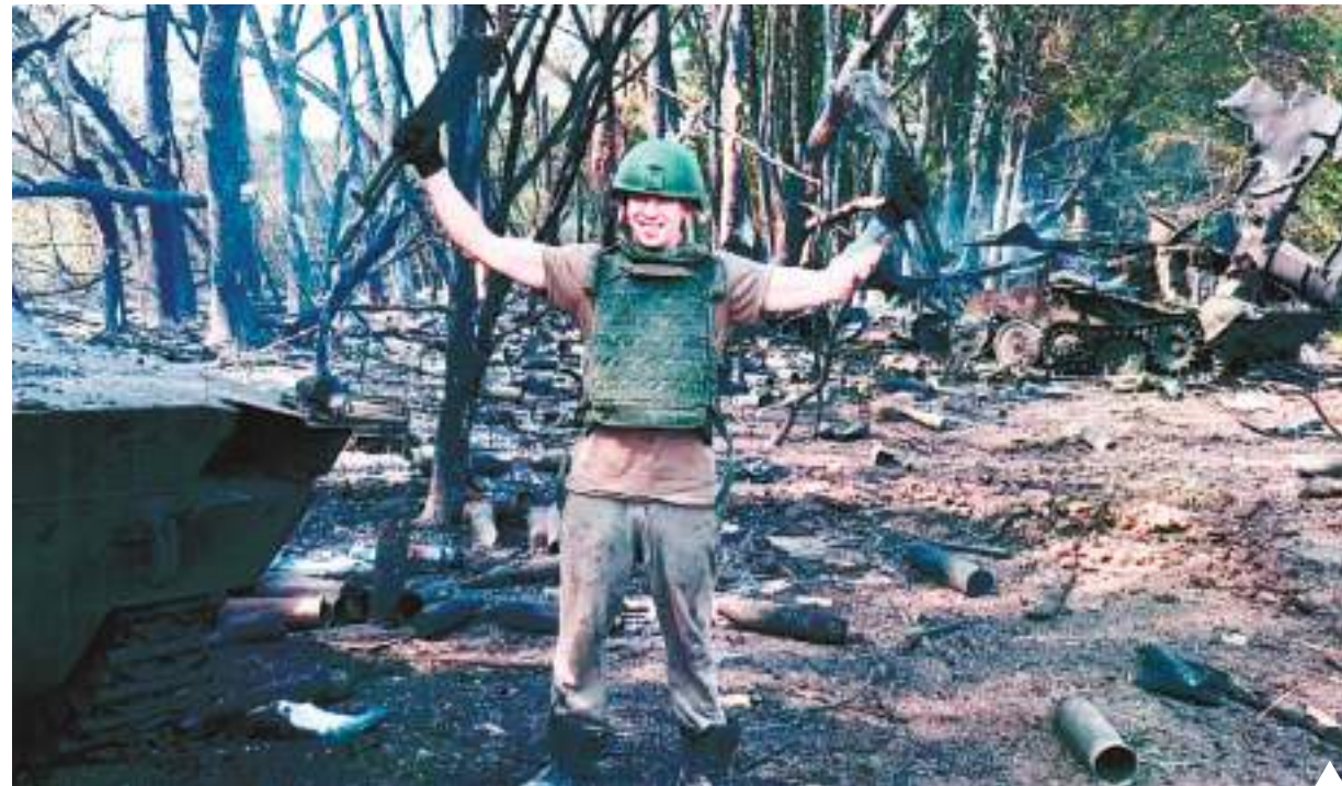
После прицельного обстрела парни остались в одних подштанниках и с обгоревшими автоматами