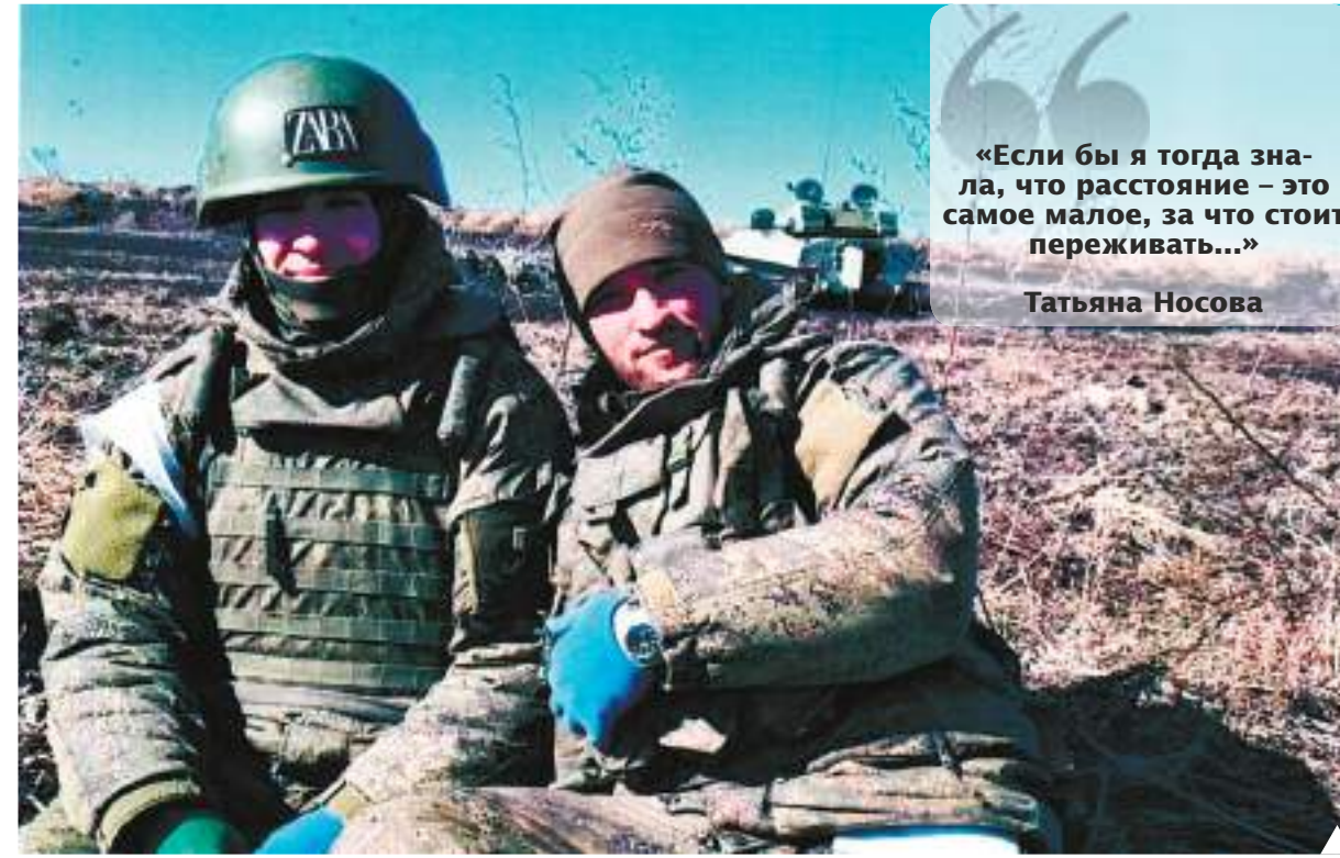
В редкие минуты тишины...

«Если бы я тогда знала, что расстояние — это самое малое, за что стоит переживать...»