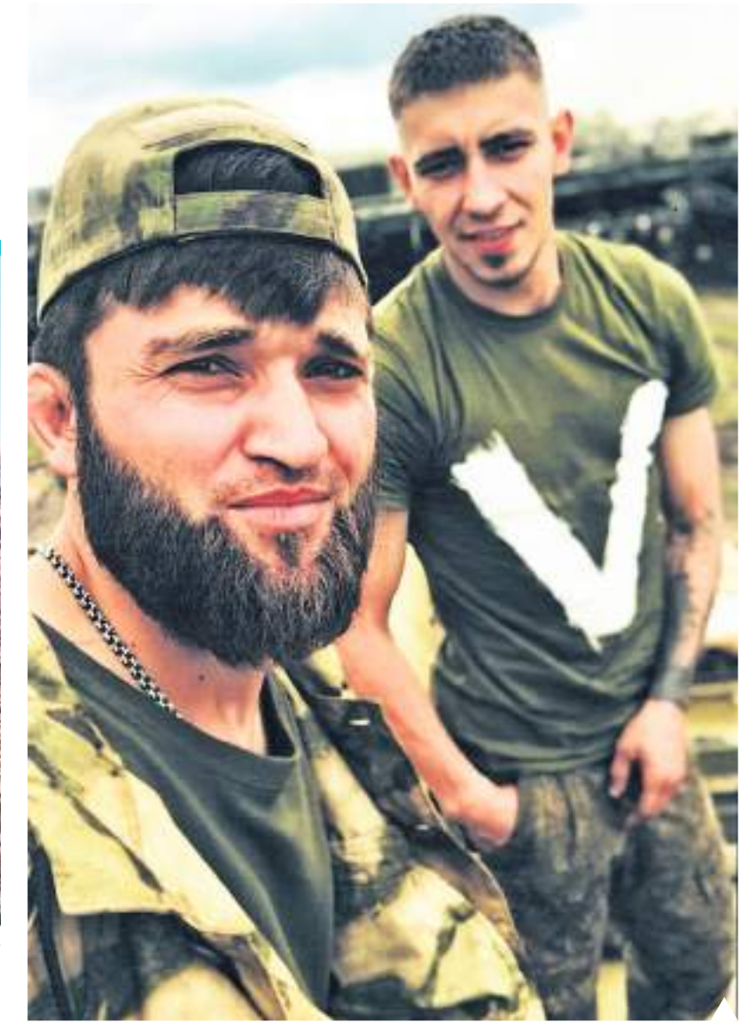
С другом Арби

А значит цель уже дана. Отмены нет — и вот они на месте, Нервы, как струна! Работают ребята вместе, Ну, в общем, как обычно, как всегда.