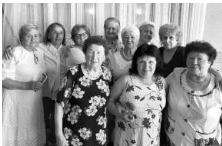
Ветераны здравоохранения Коркино